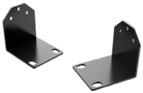
DW-G419RE Orejetas de montaje en rack de 19"